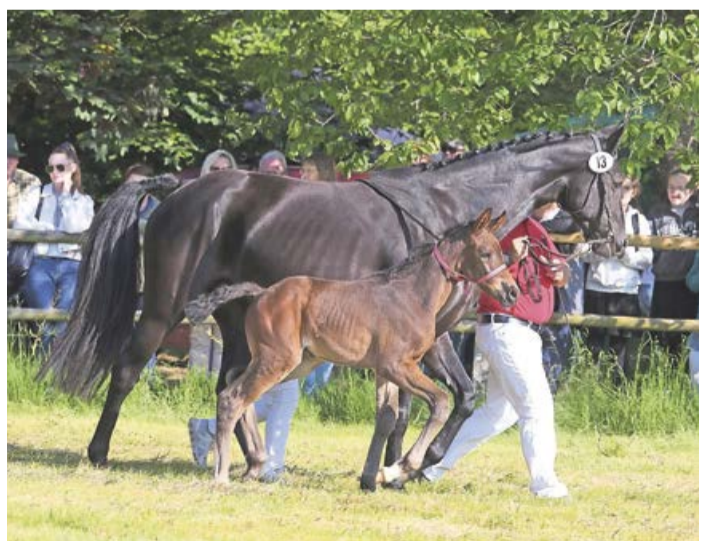
Am kommenden Freitag findet in gewohnter Weise die Stutenschau auf dem Stünzel statt.

Stünzel. Auch in diesem Jahr findet am Freitag, 28. Juni, ab 10 Uhr auf dem Festplatz Stünzel die Stutenschau des westfälischen Pferdestammbuchs statt. Wie in jedem Jahr werden dort die Fohlen der verschiedenen Rassen vorgestellt, vom westfälischen Pferdestammbuch