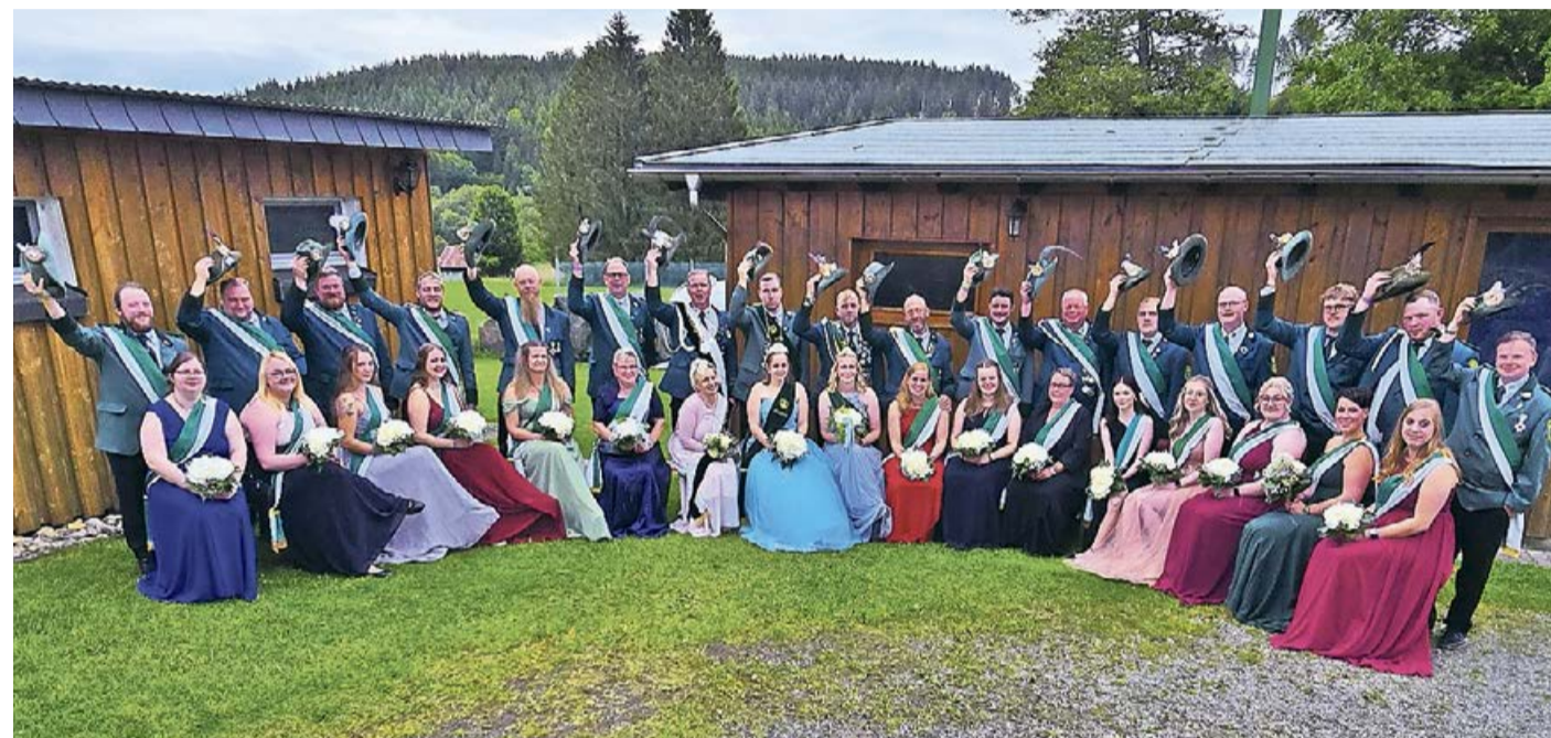
Viel zu Feiern gab es beim Schützenfest in Benfe: zum 95. Geburtstag wurde nicht nur auf einen Jugend- und Königsvogel angelegt, sondern auch ein Kaiservogel wurde um seine Preise erleichtert.

Benfe. In Benfe wurde Geburtstag gefeiert. Um es genauer zu sagen: der Schützenverein Benfe 1929 e.V. feiert in diesem Jahr sein 95-jähriges Bestehen. Und das heißt, dass nicht nur auf den Jugend- und den Königsvogel