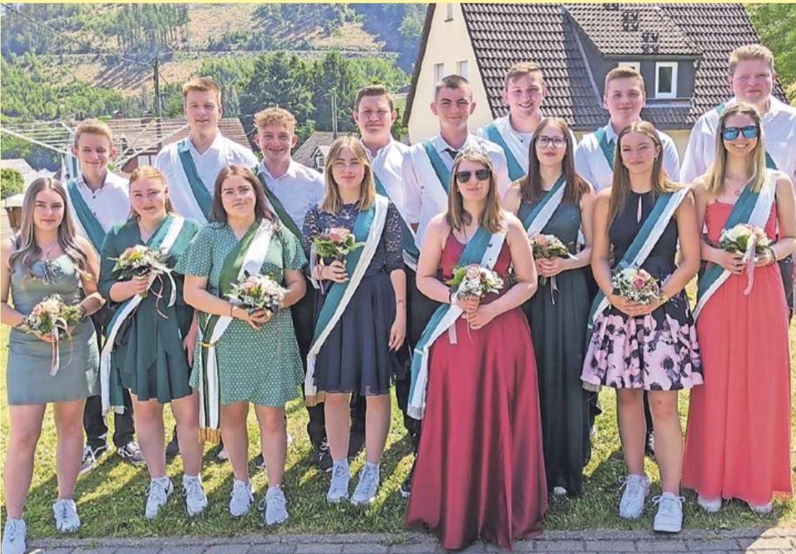
Das Jugendkönigspaar 2023 und sein Hofstaat, voller Stolz nach einem unvergesslichen Jahr.