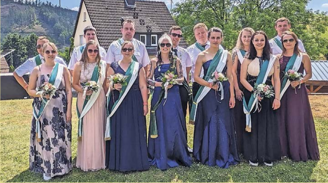
Das Königspaar von 2023 und sein Hofstaat haben ein Jahr voller unvergesslicher Momente und gemeinsamer Erfahrungen genossen.