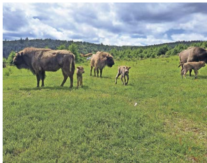
Die Kühe „Elsa“, „Quirly“ und „Quara“ mit ihrem Nachwuchs.

Wingeshausen. Die ersten Besucherinnen und Besucher haben es bereits entdeckt: Endlich gibt es wieder Nachwuchs in der Wisent-Wildnis am Rothaarsteig. Zwei weibliche Kälber und ein männliches sind dort binnen einer Woche zur Welt gekommen. Wisente bekommen in der Regel jährlich Nachwuchs. Nach einer Tragezeit von neun Monaten kommen die Kälber von Mai bis Juni zur Welt. Bei der Geburt wiegen sie