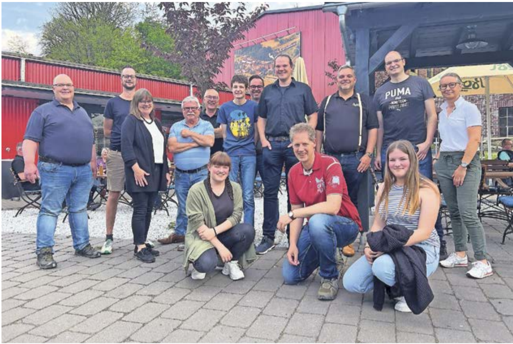
Der Gemeinschaftsverein Arfeld, Vertreter der Ludwig-zu-Sayn-Wittgenstein-Schule, die Bosch-Brauerei und einige Helferinnen und Helfer haben die Neuerungen im Zentrum Via Adrina zuletzt im Rahmen eines Dorfabends vorgestellt und laden nun alle Interessierten herzlich ein.

Arfeld. Am Zentrum Via Adrina können Gäste einige Neuerungen erleben: Eine Fahrrad-Reparaturstation, neue Parkmöglichkeiten, ein Wanderbingo für Kinder, kühle Getränke täglich im SB-Café und beim wöchentlichen Dorfabend immer mittwochs ab 18 Uhr und neue Elemente bei der Modelleisenbahn. Zudem haben Schülerinnen und Schüler