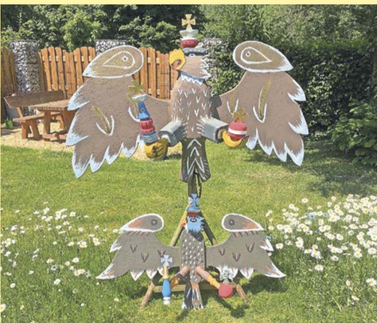
Die diesjährigen Schützenvögel warten darauf, abgeschossen zu werden.