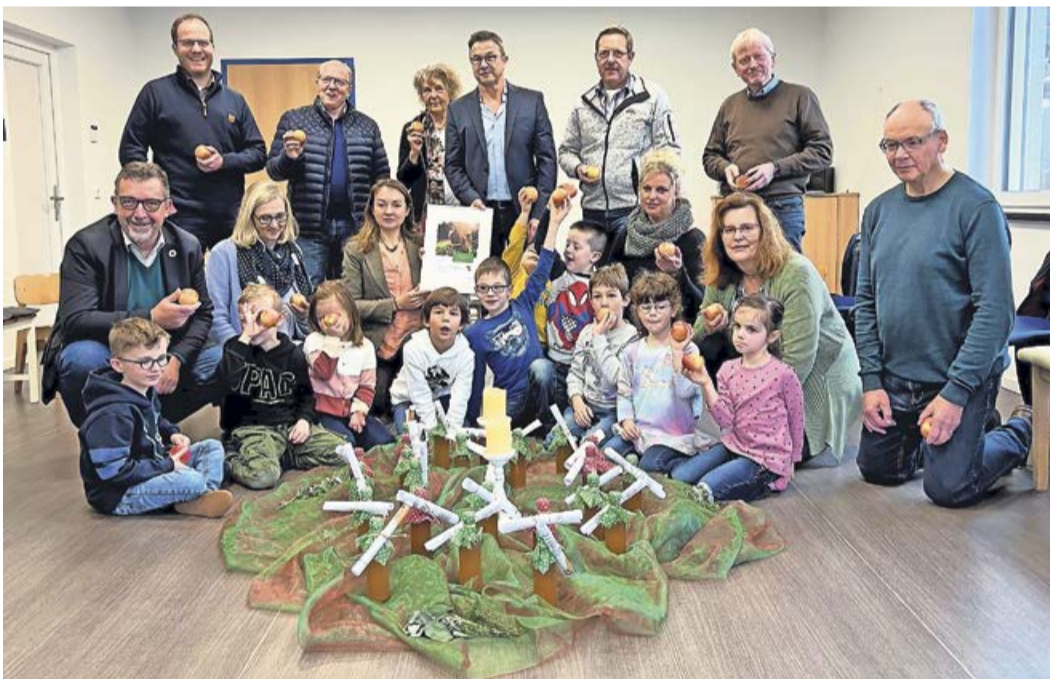
Ein Gewinn für das Klima: Die Preisträgerinnen und Preisträger – gemeinsam mit der Jury – von der vergangenen Auflage. Im Zuge des Klimaschutzpreises haben die Akteure nachhaltige Projekte umgesetzt – genau darum geht es auch bei der Neuauflage in diesem Jahr.